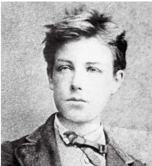
Arthur Rimbaud à 17 ans (octobre 1871)

Possibilité de visite guidée du musée Rimbaud